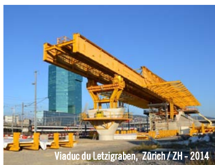
Viaduc du Letzigraben, Zürich / ZH - 2014