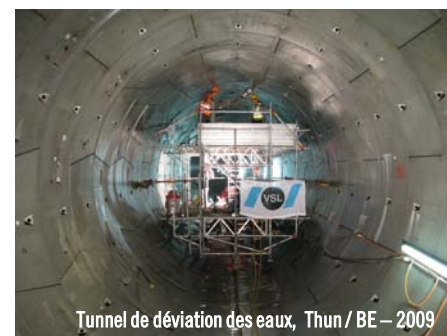
Tunnel de déviation des eaux, Thun / BE - 2009