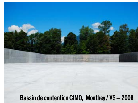
Bassin de contention CIMO, Monthey / VS - 2008