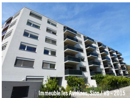
Immeuble les Avelines, Sion / VS - 2015