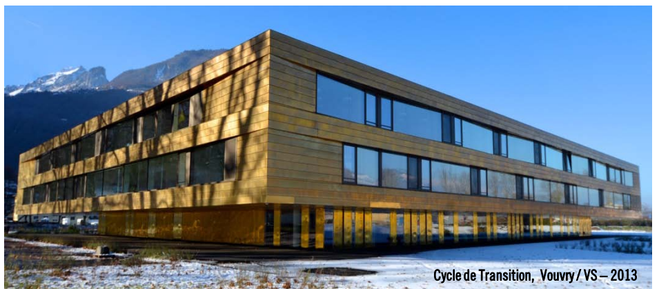
Cycle de Transition, Vouvry / VS – 2013