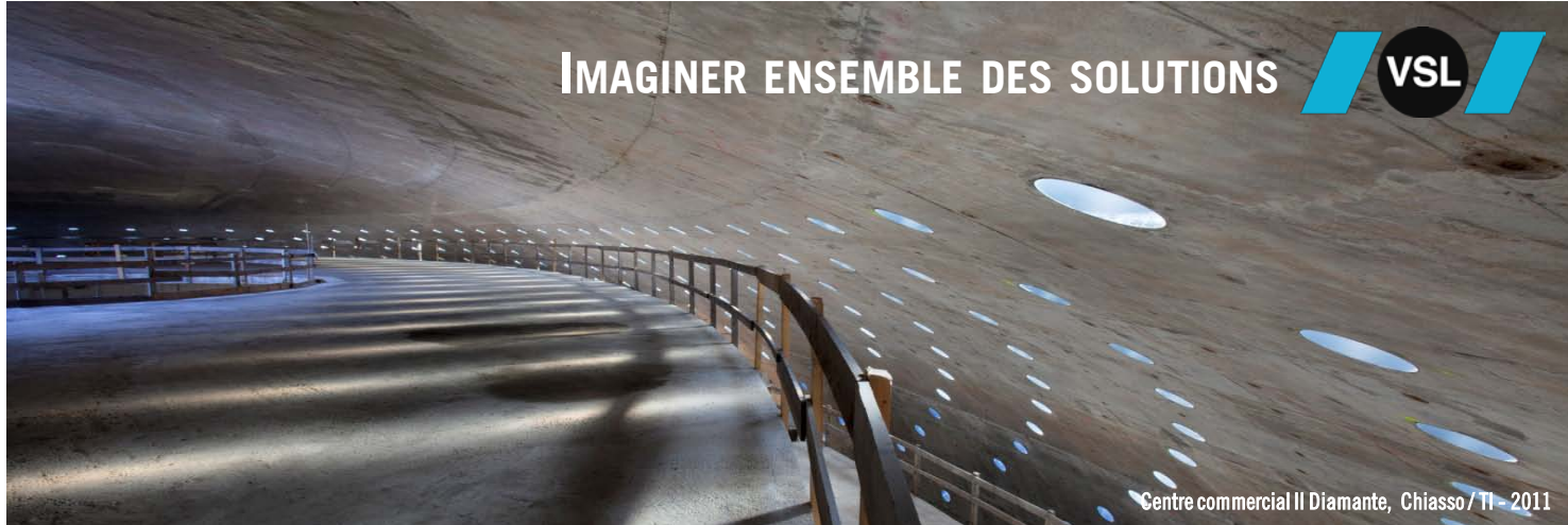
Centre commercial Il Diamante, Chiasso / TI - 2011