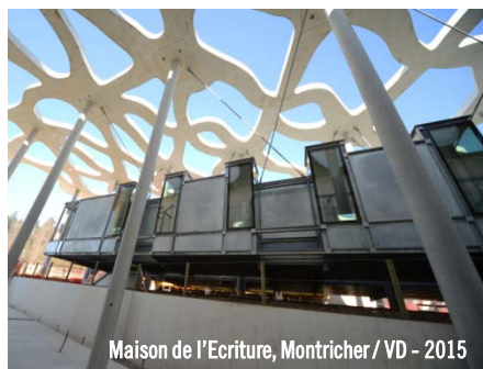
Maison de l'écriture, Montricher / VD - 2015